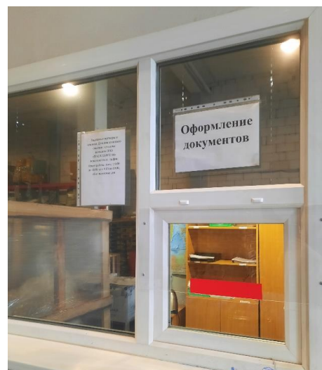
Рисунок 5. Оформление документов

На складе составляют экспедиторскую расписку, указывая в ней количество грузовых мест и характеристики груза. Документ подписывают обе стороны.