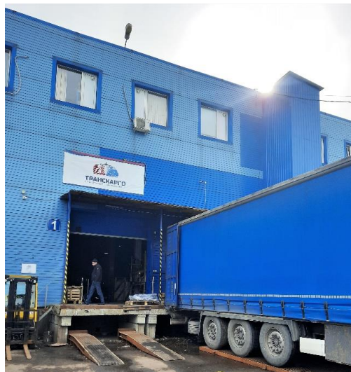
Рисунок 6. Погрузка

При пересечении границы водитель предоставляет данные документы сотрудникам пограничных служб. Они осматривают груз и проверяют соответствие перевозимого товара правилам Евразийского экономического союза. Среднее время пересечения границы составляет около 10 часов.