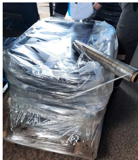
Рисунок 4. Дополнительная упаковка груза

Если клиенту необходимо, он может приобрести на складе компании «Транскарго-М» коробки для упаковки груза и другой упаковочный материал.