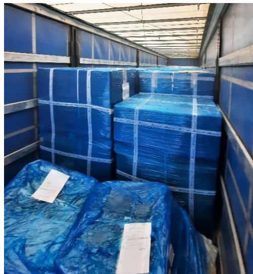
Рисунок 7. Прибытие груза

Компания «Транскарго-М» несет полную ответственность за сохранность груза – с момента его приемки до передачи грузополучателю.